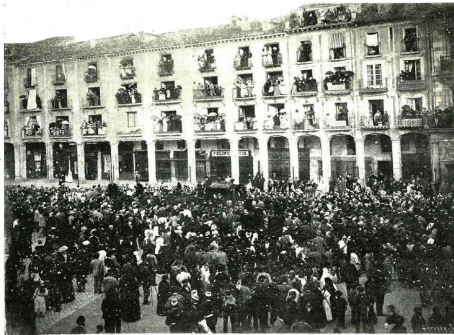
BURGOS.—ENTRADA DEL ENCOFRADO DEL SEÑOR MANUEL RUIZ ZORRILLA.—LA COFFINA FUNEBRE EN LA PLAZA MAYOR.