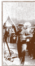
El aviador Vedrines, comenzando su apuroso en Burgos para alcanzar el vuelo hasta Madrid.