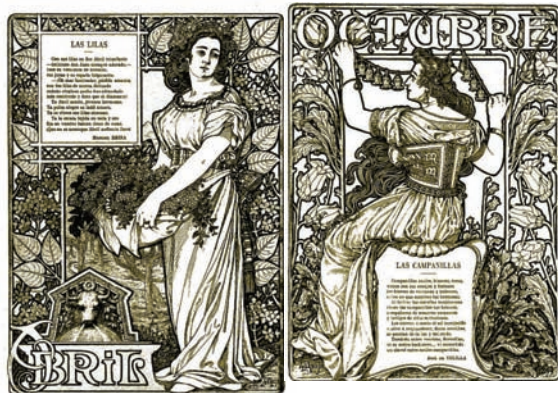
Blanco y Negro. 1899