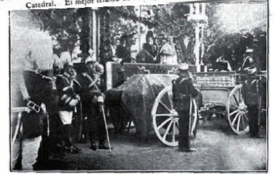
PASO DEL ARBOL SINDECIENDO LOS RESTOS DEL CID. AL DENTRAR EN FRENTE A LA TRIBUNA REGIA

LAS FIESTAS DE BURGOS SOLEMNE TRASLADO DE LOS RESTOS DEL CID Del Ayuntamiento a la Catedral. La comitiva. El Rey preside el acto. Llegada de los Restos a la Catedral. El mejor tránsito de Rodrigo de Vivar