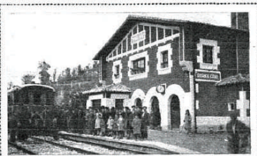
El vecindario de Ciudad, en la estación de dicho pueblo á la llegada del tren inaugural