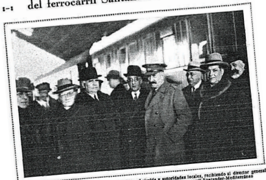
El gobernador civil de Burgos, con el gobernador militar, el alcalde y autoridades locales, recibiendo al director general de Obras Públicas, que fue á inaugurar el trozo Trespaderne-Ciudad, del ferrocarril Santander-Mediterráneo

Inauguración del trozo Trespaderne-Ciudad, del ferrocarril Santander-Mediterráneo