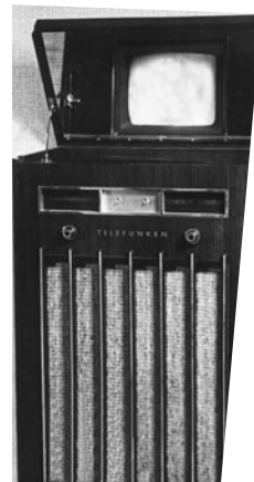
ADFA LA TELEFONOVISION

las ciudades alemanas de Berlín, Leipzig, Munich y Nuremberg. En la instalación de Burgos, ubicada en las dependencias del Servicio Nacional de Propaganda, se ha empleado la exploración por rayos catódicos en lugar de sistemas mecánicos, lo que representa el último estado de desarrollo de la televisión. La entrega de la instalación la realizó el enviado especial del Reich, Sr. Flatzen, acompañado del embajador de Alemania, señor Von Stohrer.