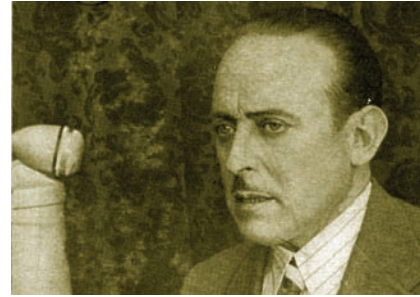
Fernando Fernández de Córdoba

el que ha informado del final de la contienda que se inició el 18 de julio de 1936. Después de sonar el gong y tras el toque de silencio a cargo del corneta navarro Rufo Bañales,