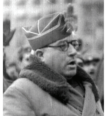
GRAN GUERRERO. EL TENIENTE GENERAL YAGUE, MUERTO AYER EN BURGOS, HABIA TRIUNFADO TAMBIEN EN LAS LIDES CIVILES DE ESPAÑA

Palacio de Capitanía, por la que han pasado miles de ciudadanos y autoridades. La ceremonia religiosa ha tenido lugar en la Catedral oficiada por el canónigo Felipe Abad y el arzobispo Pérez Platero. Fuerzas de la guarnición y del regimiento de Flandes cubrieron el trayecto de la comitiva desde la Catedral a Capitanía. Concluidos los actos oficiales los restos