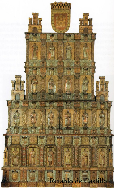
Retablo de Castilla

Entre sus obras más famosas figura el «Retablo de Castilla», realizado en 1943