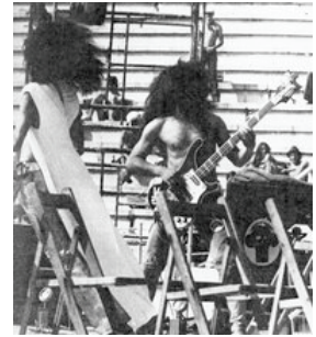
BURGOS: QUINCE HORAS DE "ROCK" DESDE UN TENDIDO DE SOL