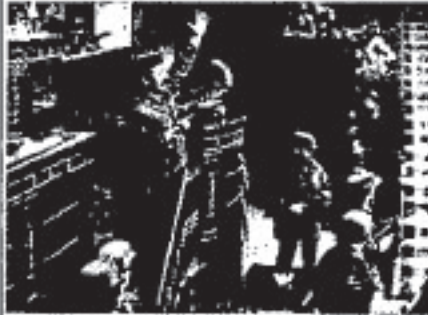
Guardias de las rebeldes se hacen fuertes en el Congreso y mantienen como rehén al Gobierno y al Parlamento