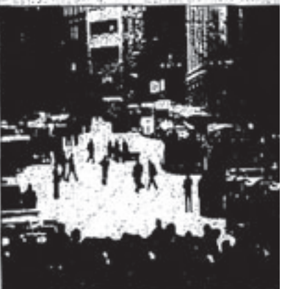
El momento de la violenta reacción alborada en la plaza.