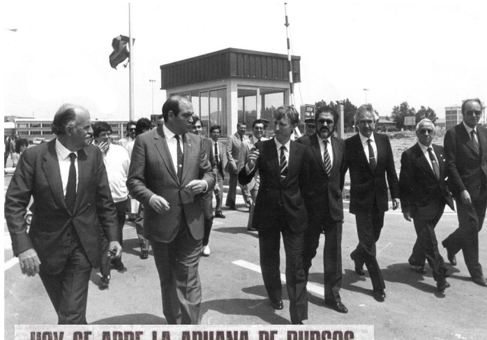
HOY SE ABRE LA ADUANA DE BURGOS