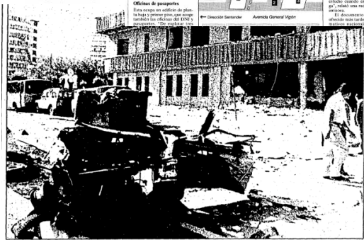
El vehículo, con sesenta kilos de amoníaco, estaba estacionado en las inmediaciones de la comisaría