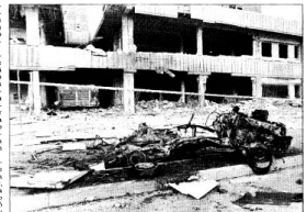
Coche bomba en Burgos

los que, según las fuentes policíacas, podría haber sido el resultado de un atentado de ETA en la ciudad. Muchos heridos, de personas resultaron heridas leves, la mayoría a consecuencia de la fuerte onda expansiva.