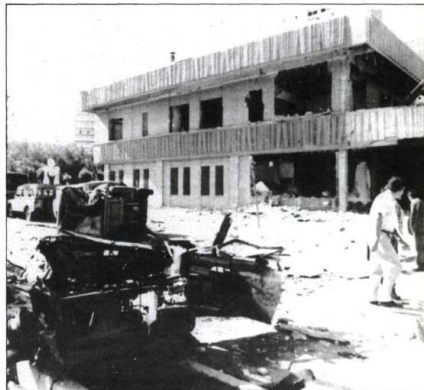
El coche-bomba destruyó vehículos y edificios adyacentes junto a la Comisaría de Burgos.

Por lo que se refiere a la segunda bomba de las que ETA ha anunciado que colocará contra Renfe, el artefacto estalló ayer a las once de la mañana entre Sanchidrián y Adana, causando desperfectos en la vía.