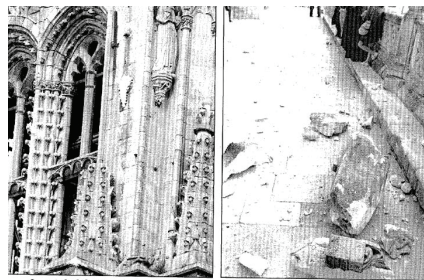
La catedral de Burgos, abandonada, se cae a pedrazos: se derrumba de una cornisa una estatua de dos metros de altura

produciendo diversos destrozos. La figura, del siglo XVII, tenía dos metros de altura y estaba adosada al cuerpo de la torre de la catedral a través de una peana mediante un mecanismo de hierro y plomo reforzado con yeso. Las piedras no han alcanzado a ninguna persona, aunque minutos antes de desplomarse la plaza de Santa María estaba repleta de público que salía de una boda en la catedral. Solo ha