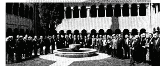
Los monjes de Silos, entre los candidatos al Príncipe de Asturias de las Artes