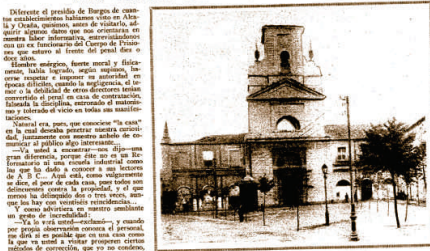
FACILIDAD PRINCIPAL DEL PENAL DE BURGOS