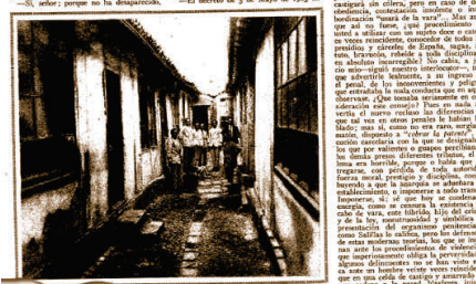
Una de las celdas (desahucio-involuntario).