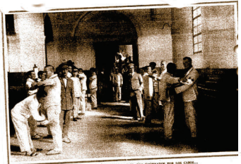
LOS BURGALÉS, AL SALIR DE SUS CELDAS, SON CENSURADOS POR LOS GUARDAS.

En un artículo de fondo publicado en el periódico madrileño ABC, se describe la vida cotidiana en el penal de Burgos. El texto menciona la disciplina estricta, los trabajos manuales que realizan los reclusos, y la presencia de guardas que controlan a los presos al salir de sus celdas. Se detallan aspectos como el ruido constante de los pasillos y la falta de privacidad en las celdas.