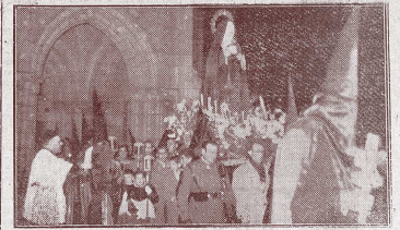
Procesión de “La Soledad”

de la Virgen, en cuya procesión también han participado los clarines ,