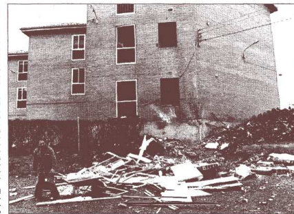
Daños causados por la explosión en el cuartel de la Guardia Civil en Lerma.

La detonación causó una gran conmoción en la villa de Lerma, de 2.500 vecinos, situada a 38 kilómetros de Burgos junto a la carretera N-I, Madrid-Irún. La explosión se produjo a las cinco de la madrugada. Según informó el Gobierno Civil de Burgos, media hora antes los centinela a la Suroccidental de Lerma se movió al a civil ue ha- aviso de «FAVIA»