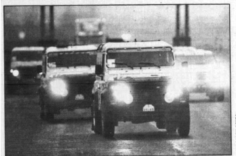
Un grupo de vehículos pasando por el peaje de Castañares a media tarde, con si niebla como acompañante.

Burgos. — Miles de burgaleses han resistido el frío y la niebla para ver el paso de la caravana del