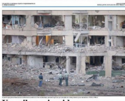
Un milagro impide una masacre